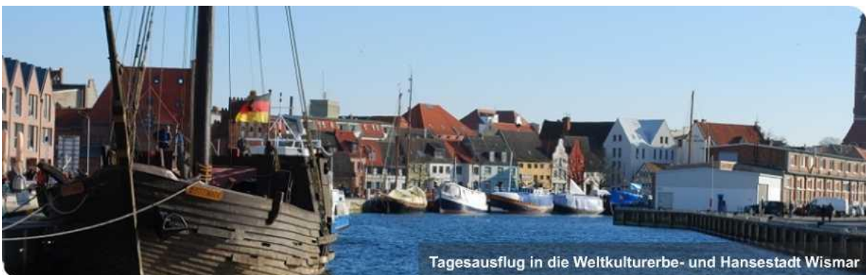
Tagesausflug in die Weltkulturerbe- und Hansestadt Wismar

Anmeldeschluss ist Dienstag, der 26.06.2018. Wir freuen uns auf euch!